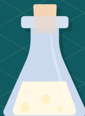
Χυμός πλούσιος σε σάκχαρα Υποπροϊόντα