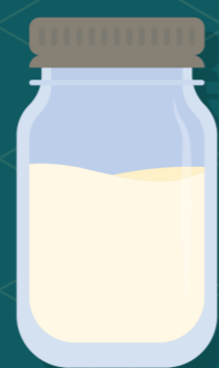
Ορός τυρογάλακτος Απόβλητα Υποπροϊόντα